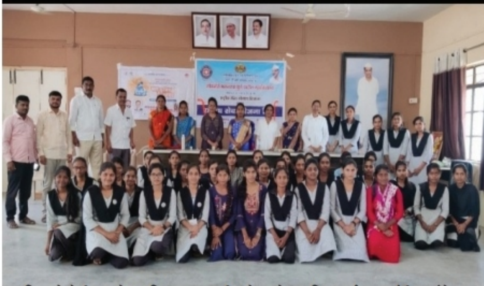
दहिगावने येथील घुले महाविद्यालयात राष्ट्रीय सेवा योजना दिन कार्यक्रम प्रसंगी स्वयंसेवक विद्यार्थी व शिक्षक